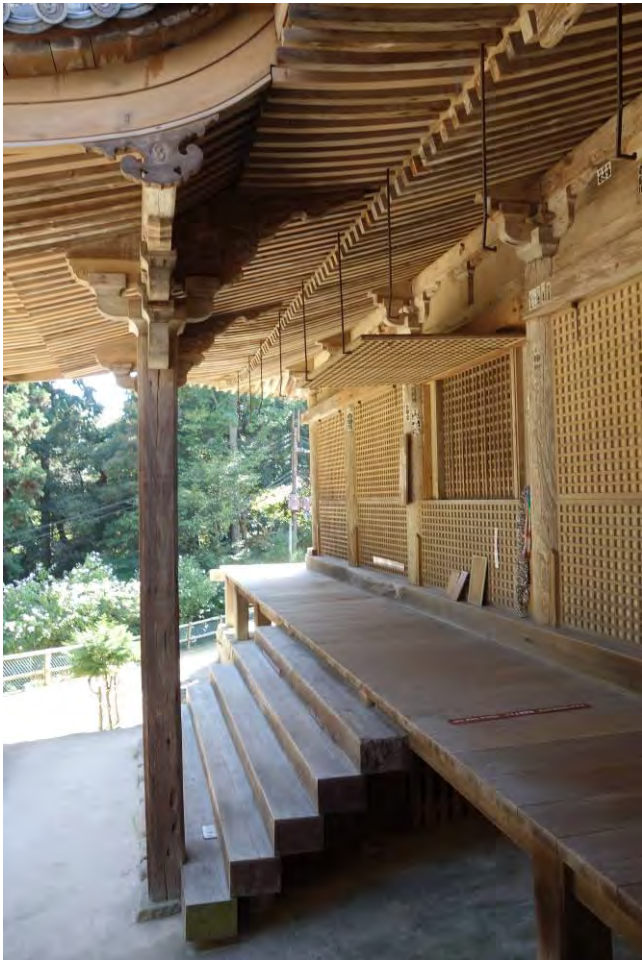
Buddistiskt tempel på Mt Shosha