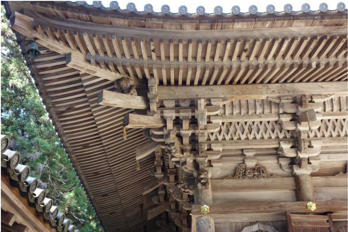
Buddistiskt tempel på Mt Shosha