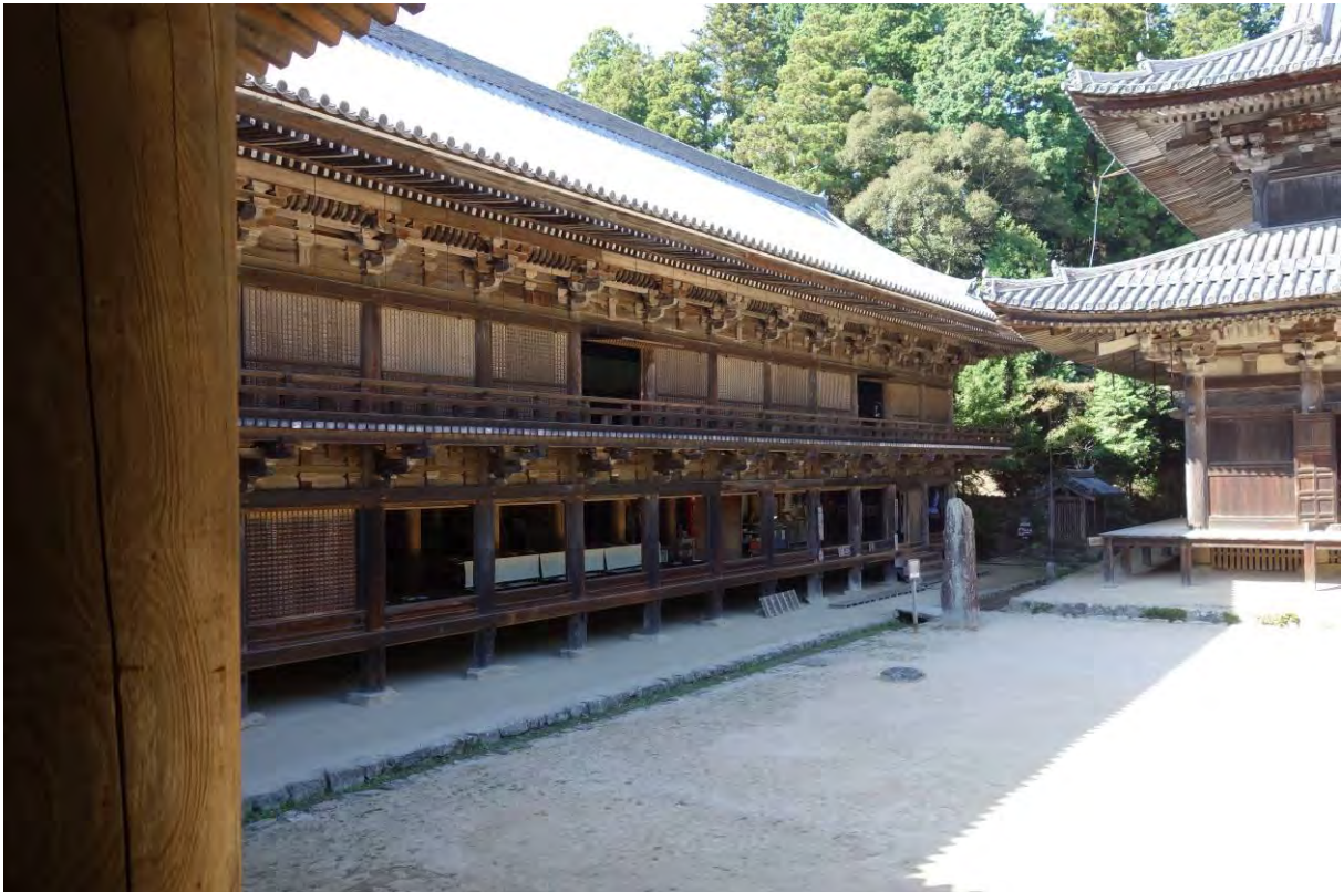
Buddhistiskt tempel på Mt Shosha