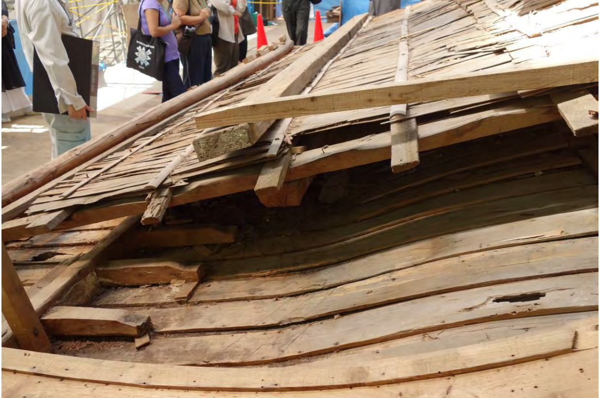
Restaurering av ett tak över ett buddistiskt tempel