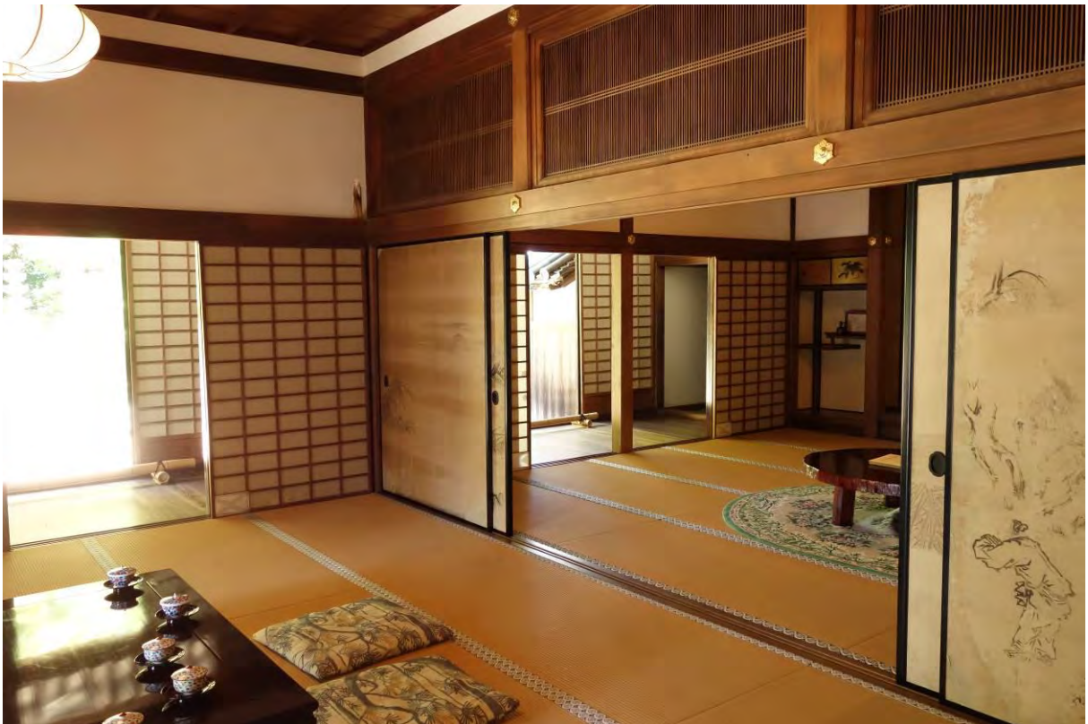
Munkarnas hus på mount Shosha