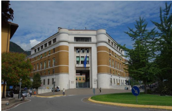
Mussolinis stadsdelar är en spegling av den gamla stadskärnan men i den då "moderna" stilen.