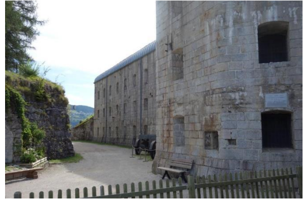
I det dramatiska gränslandskapet ligger Fort Belvedere från första Världskriget, ovan.