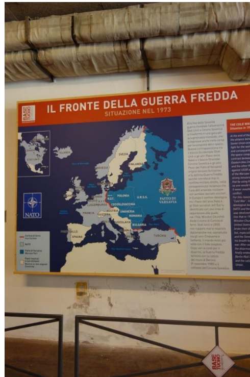
Natos Base Tuono, från efterkrigstiden "Kalla kriget" i idyllisk alpnatur.