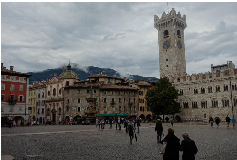
Trento, Piazza Duomo

Bolzano, på alla sidor omgivet av alplandskapet