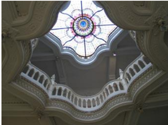
På Pest-sidan finns en rik jugendarkitektur. Interiörbilden är från den centrala entrérummet i arkitekt Ödön Lechners Postsparkasse från 1900.

På kvällen anlände vi till Pécs och jag hade turen att få bo på Hotel Palatinus nära stadens gamla torg. Ett hotell från sekelskiftet 1900 där Pécs-delen av konferensen skulle hållas.