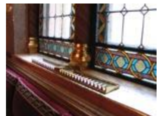
Parlamentsbyggnadens interiör är överdådigt rik med mycket guld och starka varma färger. Hantverket är utsökt och den sena 1800-talsinteriören är väl bevarad. En skojig detalj är de numrerade cigarrhållarna i pausutrymmena kring sessionssalen.