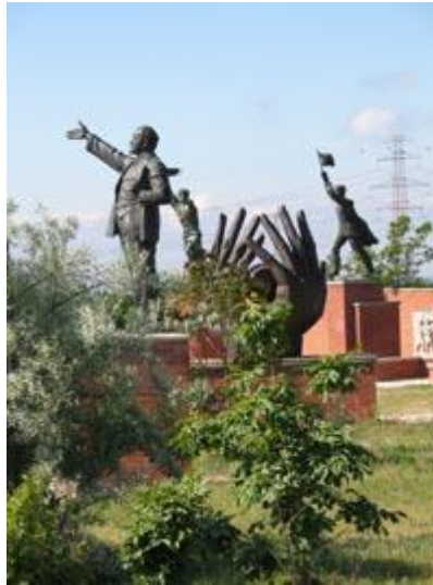
I Sczorborkparken utanför Budapest har man samlat de social-realistiska skulpturer från kommunisttiden som tidigare var placerade på stadens gator och torg.

Kvällen ägnades åt en busstur via en restaurerad moske i Siklós till Villány, där det finns många vingårdar. En härlig middag med vinprovning avnjöts i vingården Polgárs vinkällare.