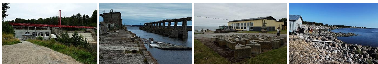
Lahemaa National Park

På torsdagen följde en studieresa till Lahemaa National Park på Estlands norra kust, med besök i olika kustområden, en tidigare sovjetisk flottbas och ett privat sjöfartsmuseum. I slutmålet Viinistu har en fiskfabrik förvandlats till kulturcentrum med teater, utställningar och ett privat konstmuseum.